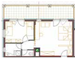
Genießer-Studio „Sonnenschein“ Beispiel für ein Familienzimmer für 4 Personen

Für Ihre perfekte Erholung: vom Land NÖ zertifizierte Genießer-Studios Sonnenschein mit Terrasse